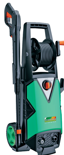
CLEAN BOY 160