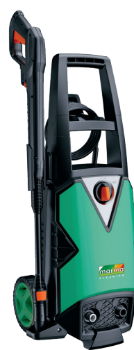
CLEAN BOY 140